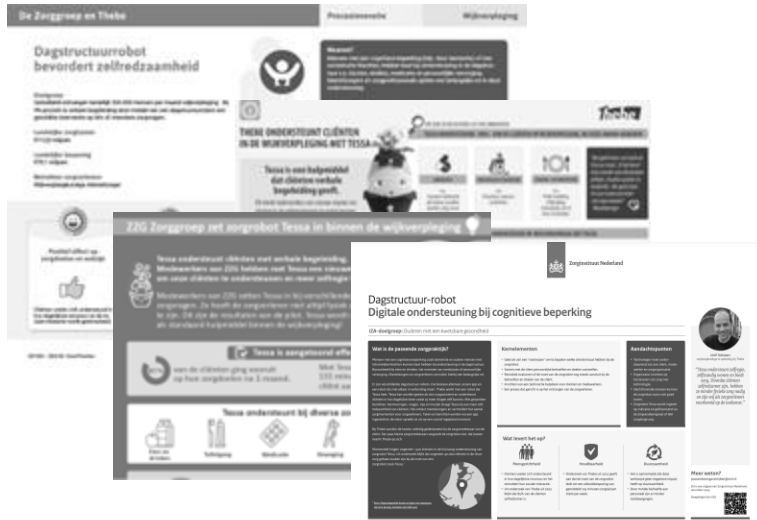
Illustraties uit rapporten over TESSA

Diverse rapporten tonen de impact van TESSA aan